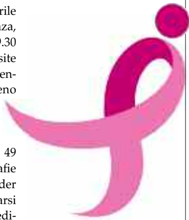
Nella foto, il logo di Susan Komen

In particolare, la Carovana si rivolge a donne che vivono in condizioni di disagio sociale ed economico e che per questo dedicano meno attenzione alla propria salute. La tutela della salute femminile ha importanti ricadute sul benessere della collettività, per il ruolo fondamentale della donna in ambito familiare, lavorativo e sociale.