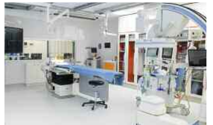
Nella foto, tratta dal sito dell'ospedale, la nuova sala dedicata alle aritmie cardiache