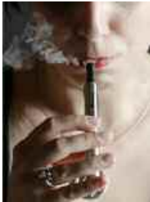
I ricercatori scettici sul "palativo"

Chi usa le sigarette elettroniche sarebbe soggetto a cambiamenti nel Dna che possono essere paragonati a quelli osservati nei fumatori tradizionali. E' ciò che si evince da uno studio, pubblicato sulla rivista Cancer Research , condotto da ricercatori dell'University College di Londra e dell'Università di Innsbruck. Gli esperti, guidati da Chiara Herzog, hanno analizzato gli effetti epigenetici del tabacco e delle sigarette elettroniche sui geni di oltre 3.500 volontari, per poi valutare le conseguenze derivanti dall'uso di questi prodotti, spesso venduti come alternativa più salutare rispetto alle normali sigarette.