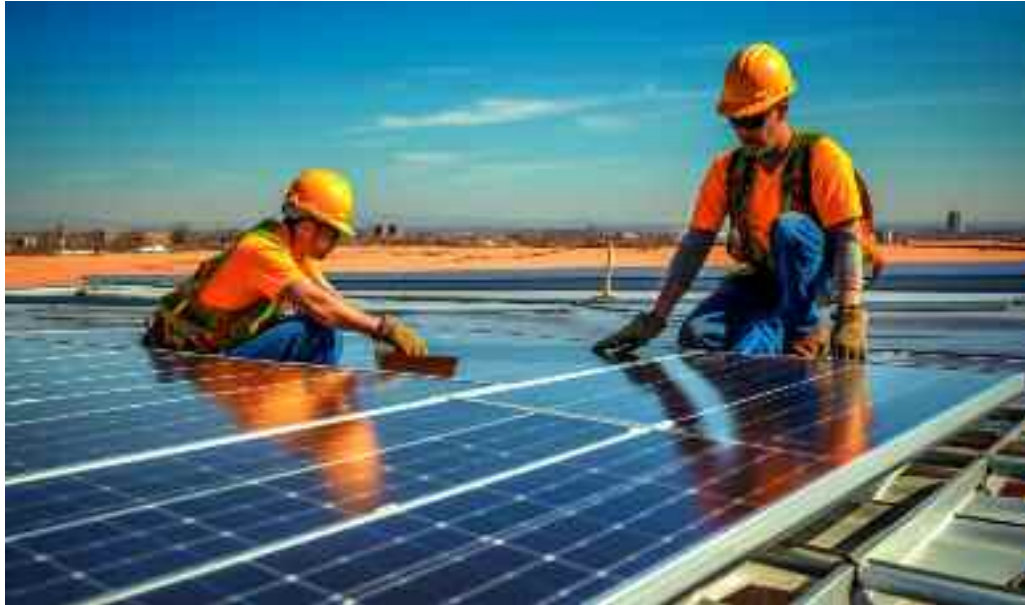
I nuovi rapporti di Legambiente fotografano la situazione italiana che mostra evidenti lacune di programmazione

simbolo di blocchi alle rinnovabili” mappati da Legambiente: “si va da 6 amministrazioni locali tra Veneto, Umbria, Marche e Basilicata che preferiscono poli logistici e industriali a parchi eolici o fotovoltaici, alle moratorie tentate o in programma come accade in Sardegna e Abruzzo, dove è intervenuta la Corte Costituzionale, o la simil moratoria della