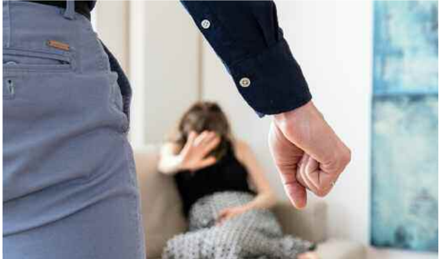
Italia capofila nel triste primato con Germania, Slovenia e Grecia

Sono stati 120 i casi di femminicidio, di cui 52 perpetrati da un partner o dall'ex, in un solo anno. Ovvero una donna uccisa ogni tre giorni. Ma non solo, perché sono sette milioni le donne ad aver subito in Italia, almeno una volta nella vita, violenza fisica o sessuale. Numeri allarmanti, frutto di uno studio Unicusano, che relegano l'Italia negli ultimi posti in Europa per le politiche di contrasto al fenomeno della violenza di genere. Appare allora evidente come ci trovi di fronte a un'escalation di violenza che sta colpendo non solo l'Italia ma anche Paesi come Germania, Slovenia e Grecia. Chi sta invece ottenendo risultati incoraggianti sono Cipro e Malta i cui governi hanno adottato misure legali specifiche riconoscendo il femminicidio come reato autonomo. Anche la Spagna, l'Irlanda e la Lituania hanno migliorato le loro politiche di contrasto alla violenza di genere durante la pandemia, rinforzando piani nazionali preesistenti. In questo quadro si inserisce il master "Trattamento sex offender, maltrattamenti e vittime di abusi", primo del suo genere in Italia. A promuoverlo l'Unicusano: attraverso il corso,