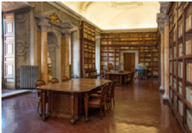
Open House. Biblioteca dell'Accademia dei Lincei